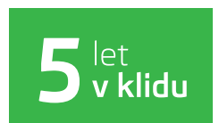
Předplacený servis na 5 let / 100 000 km při financování od ŠKODA Finance